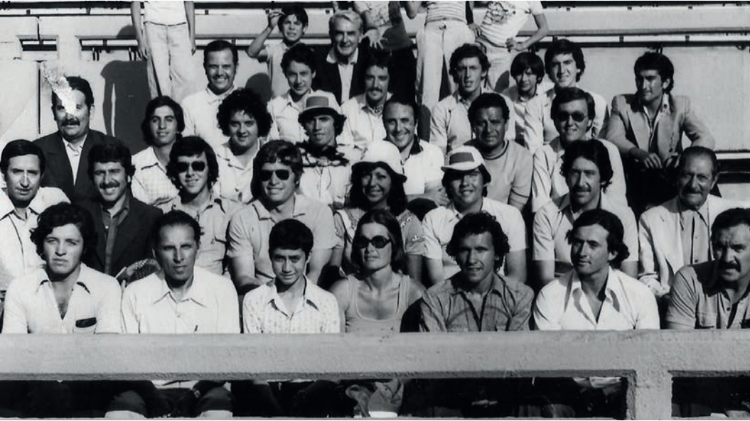
||| Equipo de árbitros en la Final de la Copa Davis con Italia en 1976.

Sebastián se acerca a la intrusa y me la presenta, era nada menos que la bella actriz del film, quien sin divismo ninguno me saludó cariñosamente. La actriz vestía de forma muy sencilla. La breve conversación que se produjo entre ella y Sebastián me permitió apreciar esa suavidad del idioma ruso, el cual siempre me ha parecido muy melódico, muy musical, y que en voz de tan bella mujer era aún mas sensual.